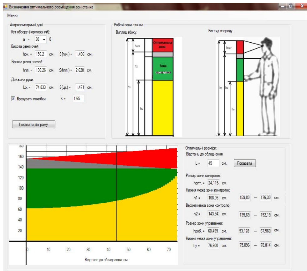
Рис.2. Визначення оптимального розміщення зон обладнання

ся обчислення. Також тут ілюстровано, як правильно визначити необхідні для обчислень значення (рис. 2).