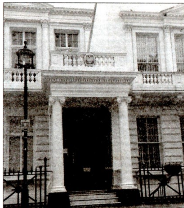
Приміщення Польського Інституту і музею ім. Сікорського у Лондоні, де виявлено архів Українського пресового бюро

Чому світ голосно заговорив про Україну у 30-х роках ХХ століття? Восени 1930 року польська влада серед українського населення Галичини проводила рішучі репресії, що увійшли в історію під терміном пацифікація. За вказівкою Пілсудського в українські села були направлені карні загони, які знущалися над українцями. Репресій зазнали передусім учителі, священники, громадські активісти. Були розгромлені «Просвіти», бібліотеки, кооперативи. Було спалено багато житлових будинків і господарських споруд.