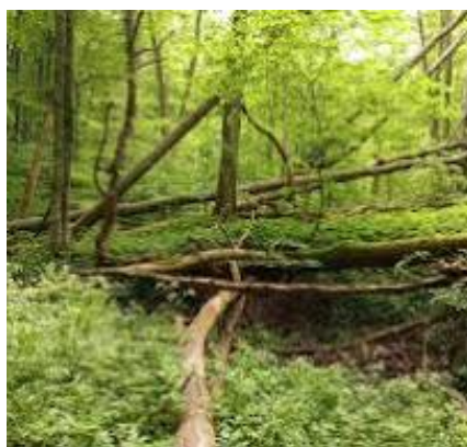
Буковий ліс у с. Пеняках (Львівська обл.), який живе і дихає як заповідний резерват В.Дідушицького.

Ентузіаст-дослідник і практик охорони природи – це цілком заслужене визнання Володимира Ксаверія Дідушицького.