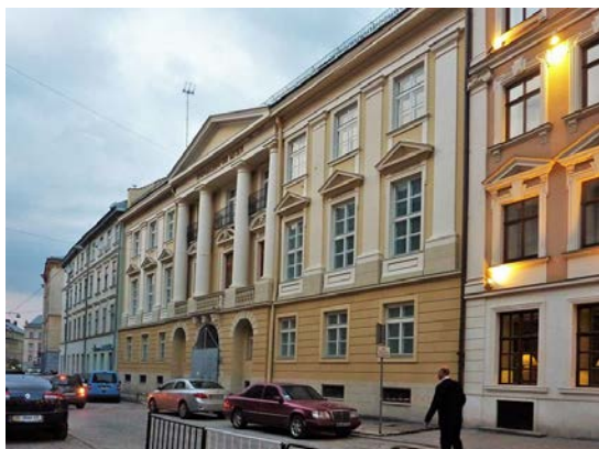
Природничий музей у Львові, де зберігається велика кількість експонатів з колекцій В.Дідушицького.